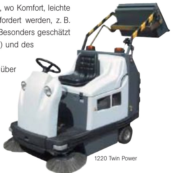
1220 Twin Power

Das Modell Sprint 1220 spielt überall dort seine Stärken aus, wo Komfort, leichte Bedienbarkeit und hohe Kehrleistung im Überkopfprinzip gefordert werden, z. B. beim Hausmeistereinsatz, in Lagerhallen oder auf Hofflächen. Besonders geschätzt werden die Vorteile des Batterieantriebs (für den Halleneinsatz) und des Benzinantriebs (zur Reinigung von Außenflächen) bei unserem Sondermodell 1220 TP (Twin Power). Diese Maschine verfügt über einen Hybrid-Antrieb und kann sowohl im Batterie- als auch im Benzinmodus betrieben werden.