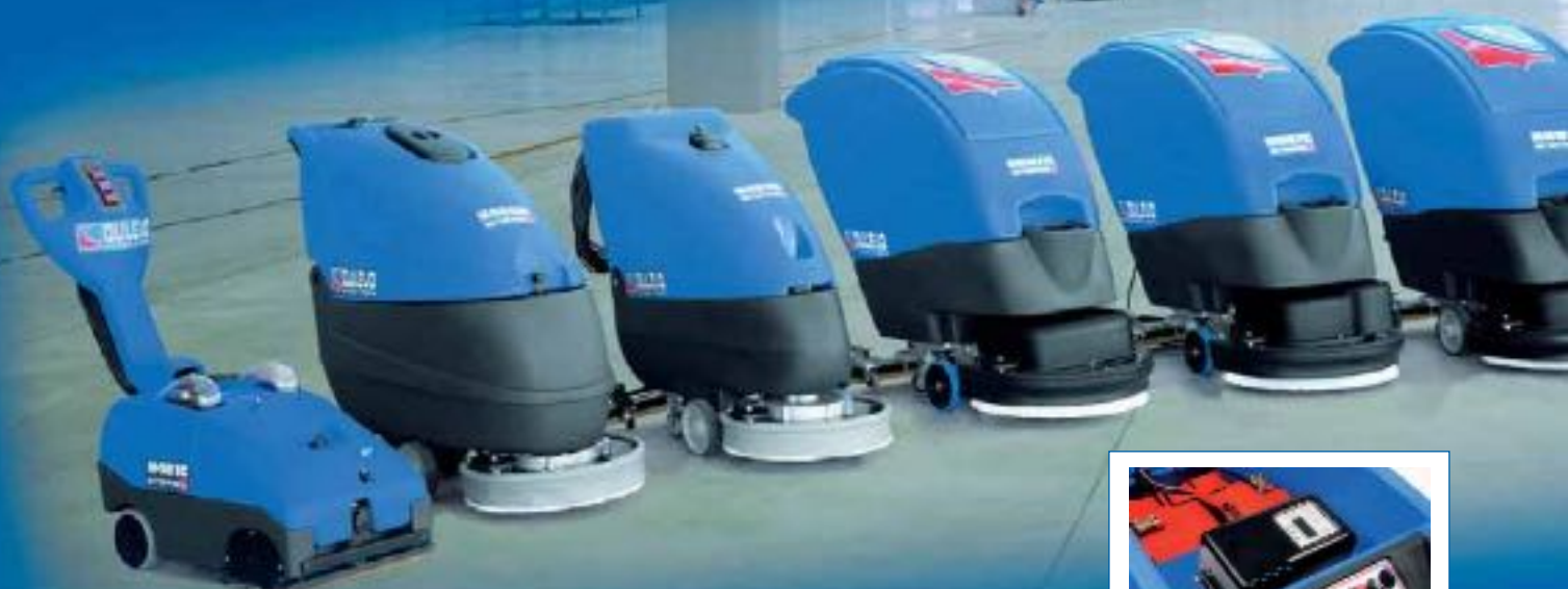
Auch mit integriertem Ladegerät erhältlich.