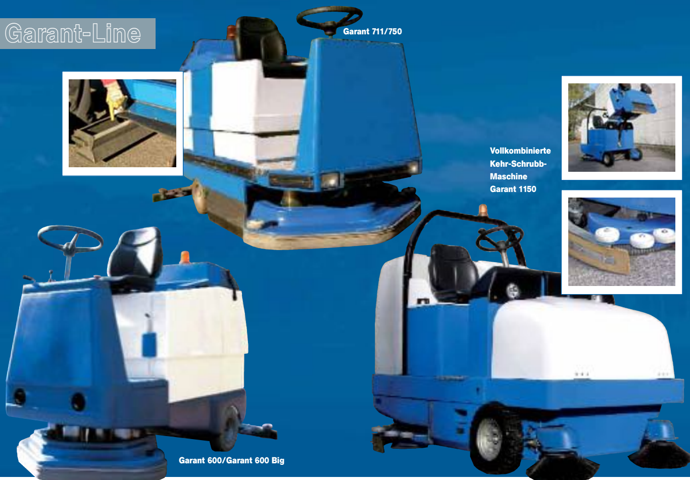
Vollkombinierte Kehr-Schubb- Maschine Garant 1150

Garant 600/Garant 600 Big Das Modell G 600 verbindet die Ansprüche des industriellen Kunden in einer kompakten Bauweise. So bietet die freipendelnd angehängte Drei-Bürsten-Technik ein perfektes Ergebnis - auch auf unebenen Bodenverhältnissen. Die optional lieferbare Spezialbereifung (Ballon) absorbiert bis zu 85 % der Vibrationen, schützt so die gesamte Fahrzeugtechnik und bietet dem Bediener höchsten Komfort.